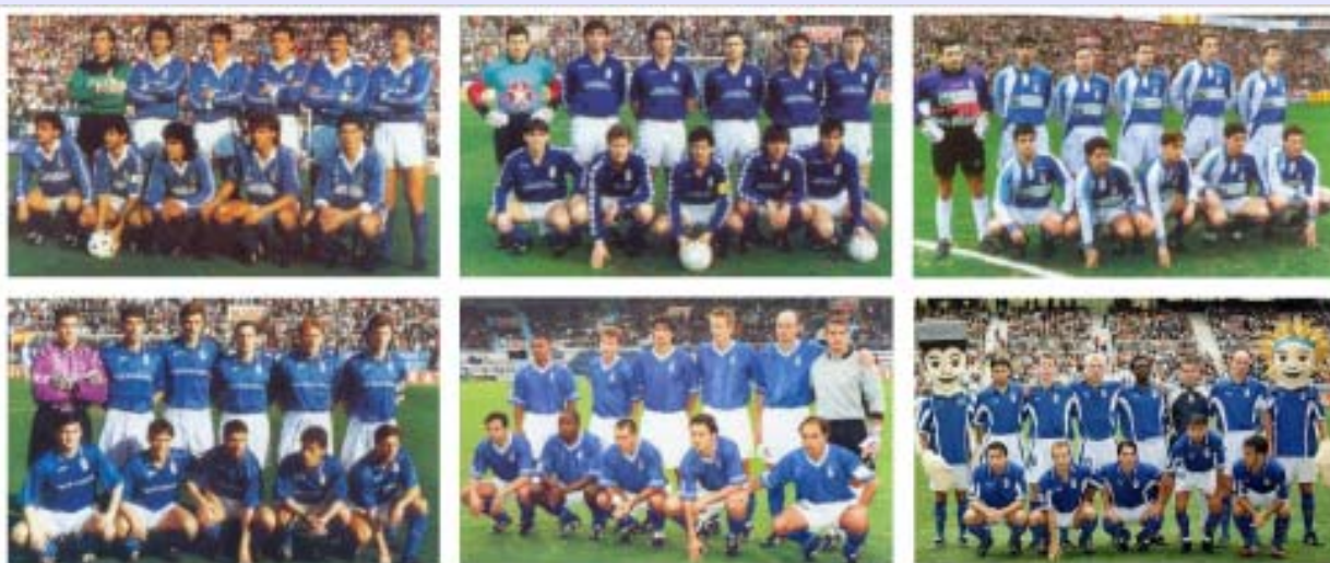
a partir de los ochenta los diseños se multiplican

Ya fuese por el cambio de marca –al principio- o por cambiar una misma marca el diseño para cada campaña, la variedad en la indumentaria será una constante a partir de entonces, unas veces con alteraciones discretas de lo que se podría considerar más clásico y otras con variaciones más llamativas, siempre sobre la base de camiseta azul, pantalón blanco y medias azules, siendo el azul casi siempre oscuro (si bien para la conmemoración del 75 aniversario de la entidad se diseñó una indumentaria que utilizaba el cian puro como color de la sociedad justificándolo en la facilidad a la hora de afrontar la reproducción). El concepto de merchandising se haría desde entonces familiar.