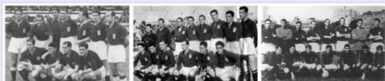
con alguna excepción, en los años cuarenta, cincuenta y sesenta las camisetas son de un azul mucho más oscuro

Tras la Guerra civil se aprecia con el paso de los años que las sucesivas camisetas van oscureciendo la tonalidad de azul a la vez que la aparición del escudo a la altura del corazón se hace habitual. A su vez se irán introduciendo paulatinamente las medias de color azul como seña de identidad. En la segunda mitad de la década las camisetas son ya de una azul mucho más intenso similar al característico de la ciudad.