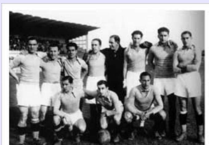
equipación habitual hasta la Guerra Civil

por el nuevo club, es decir, desde la temporada 1926/27 -la primera iniciada desde el principio como tal- tenían grandes cuellos y una tonalidad más cercana al azul celeste que al azul propio de la ciudad.