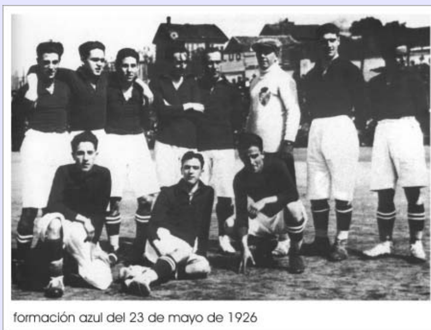
formación azul del 23 de mayo de 1926

No obstante hay que destacar la circunstancia anecdótica de que en los dos primeros partidos disputados por el nuevo equipo, éste lo hace uniformado con camisetas blancas (con pantalones también blancos el primer día y negros el segundo). En su tercera comparecencia, por contra, se adivinan en las fotografías en blanco y negro unas camisetas oscuras.