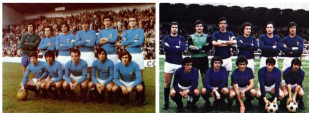
los años setenta comienzan y concluyen con el uso de azules diametralmente opuestos

constante. Las primeras marcas que vistieron al Real Oviedo (PUMA, MEYBA, KELME, etc.) no fueron ajenas a las modas y comenzaron a aparecer diversos elementos en las zonas de los hombros y en los laterales de los pantalones combinando los colores de la vestimenta (azul y blanco). Además, la aparición de la publicidad sería otro elemento novedoso que añadir a unas camisetas que en las décadas anteriores únicamente se habían visto alteradas por la introducción de la numeración –en el caso de las oviedistas, de color blanco-.